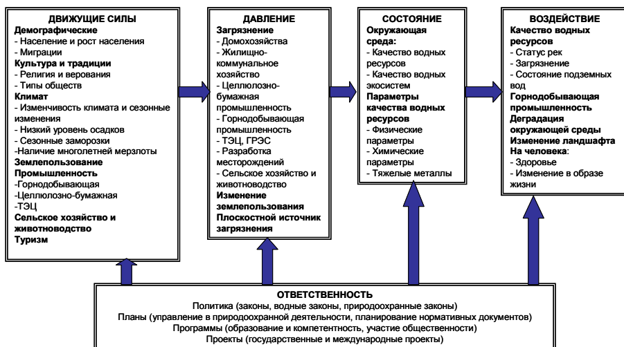
Рис. 3. Схема DPSIR-анализа

В этой связи для определения основных подходов к решению экологических проблем в бассейне р. Селенги нами применена методика DPSIR-анализа (D-«Drivers» – Движущие силы; P-«Pressure» – Давление; S – «State» – Состояние; I-«Impact» – Влияние или воздействие; R-«Responses» – Ответственность), разработанная Европейским экологическим агентством (рис. 3).