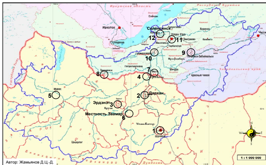
Рис. 4. Основные источники негативного воздействия на водные ресурсы в бассейне р. Селенги

этажных жилых домов); создание системы управления сбором твердых бытовых отходов.