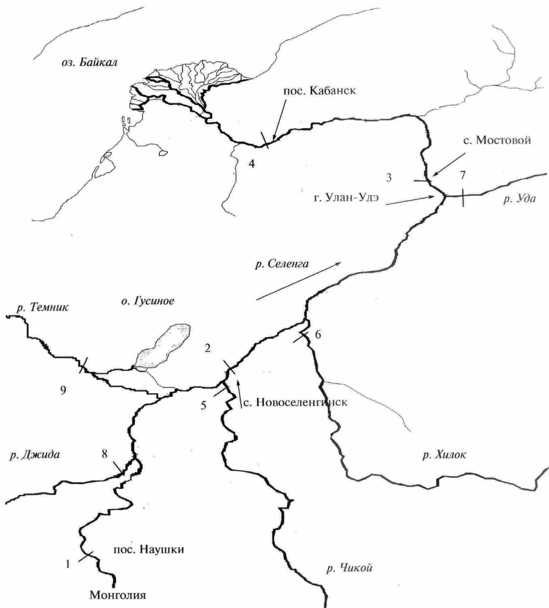
Рис. 1. Карта-схема района исследований. 1–9 — номера точек отбора проб.