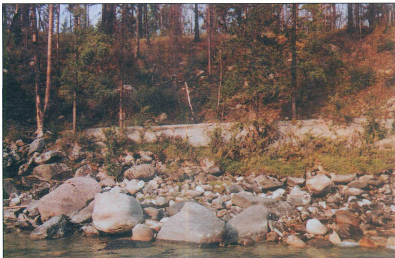
Паводковые песчаные отложения на уступе 8-метровой правобережной террасы Иркута в районе впадения в него р.Хурумы.