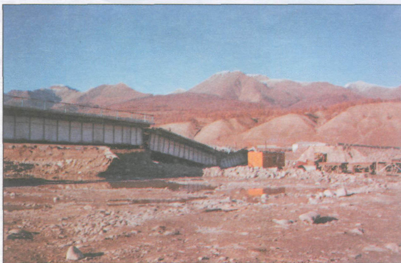
Разрушенный мост через р.Иркут в пос.Монды.