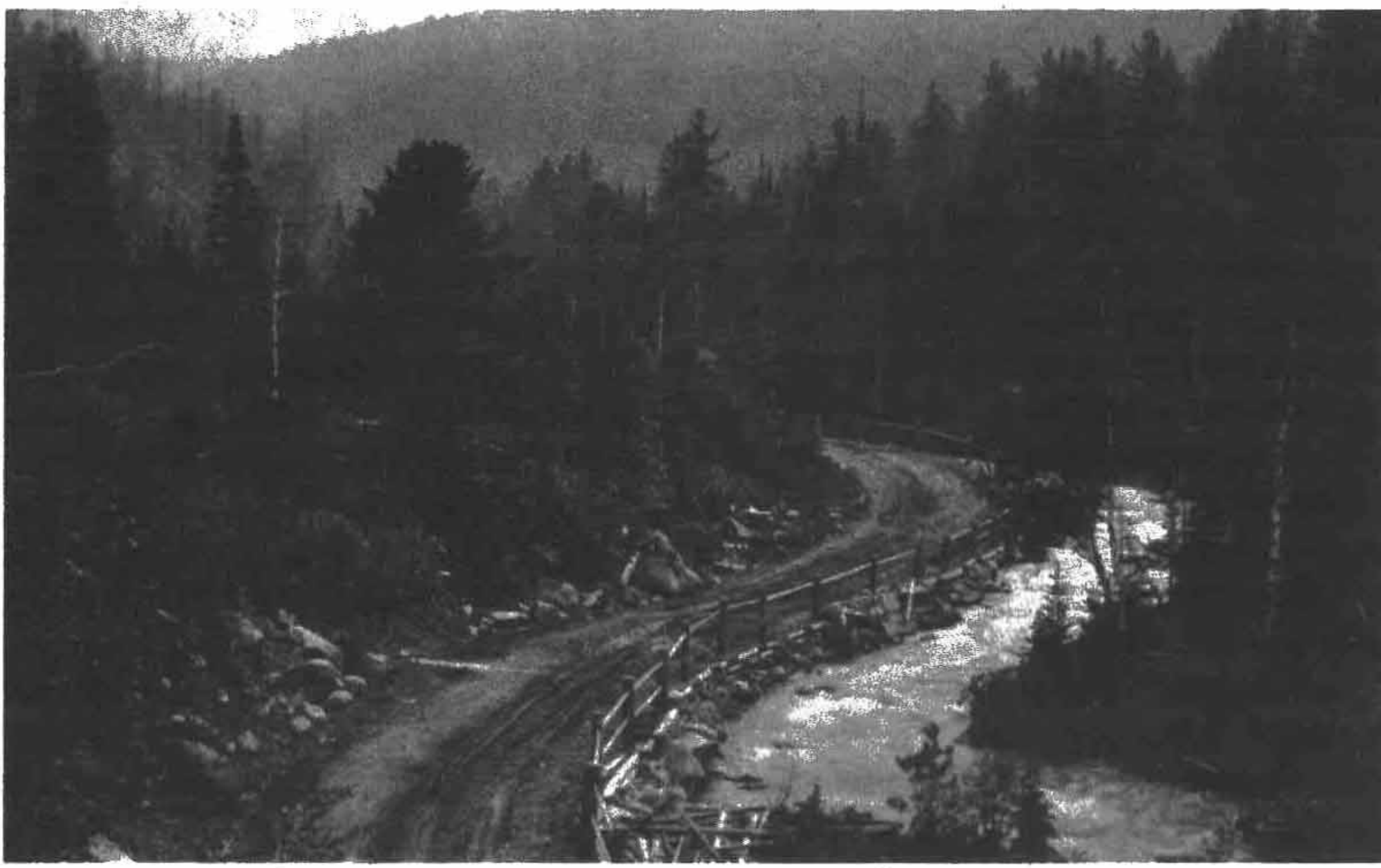
Удунгинский тракт.

Частью байкальской Даурии, которую мы должны были преодолеть, была горная цепь Хамар-Дабан, отдельные вершины которой достигают высоты 1400 м. Через эти горы, которые связывают эти места с Монголией, проходит один из крупнейших трактов. Эта дорога была проложена в начале прошлого века богатыми купцами из Кяхты для перевозки китайского чая и монгольского убойного скота. Почти целое столетие этот тракт имел огромное значение для торговли. Поэтому его называют