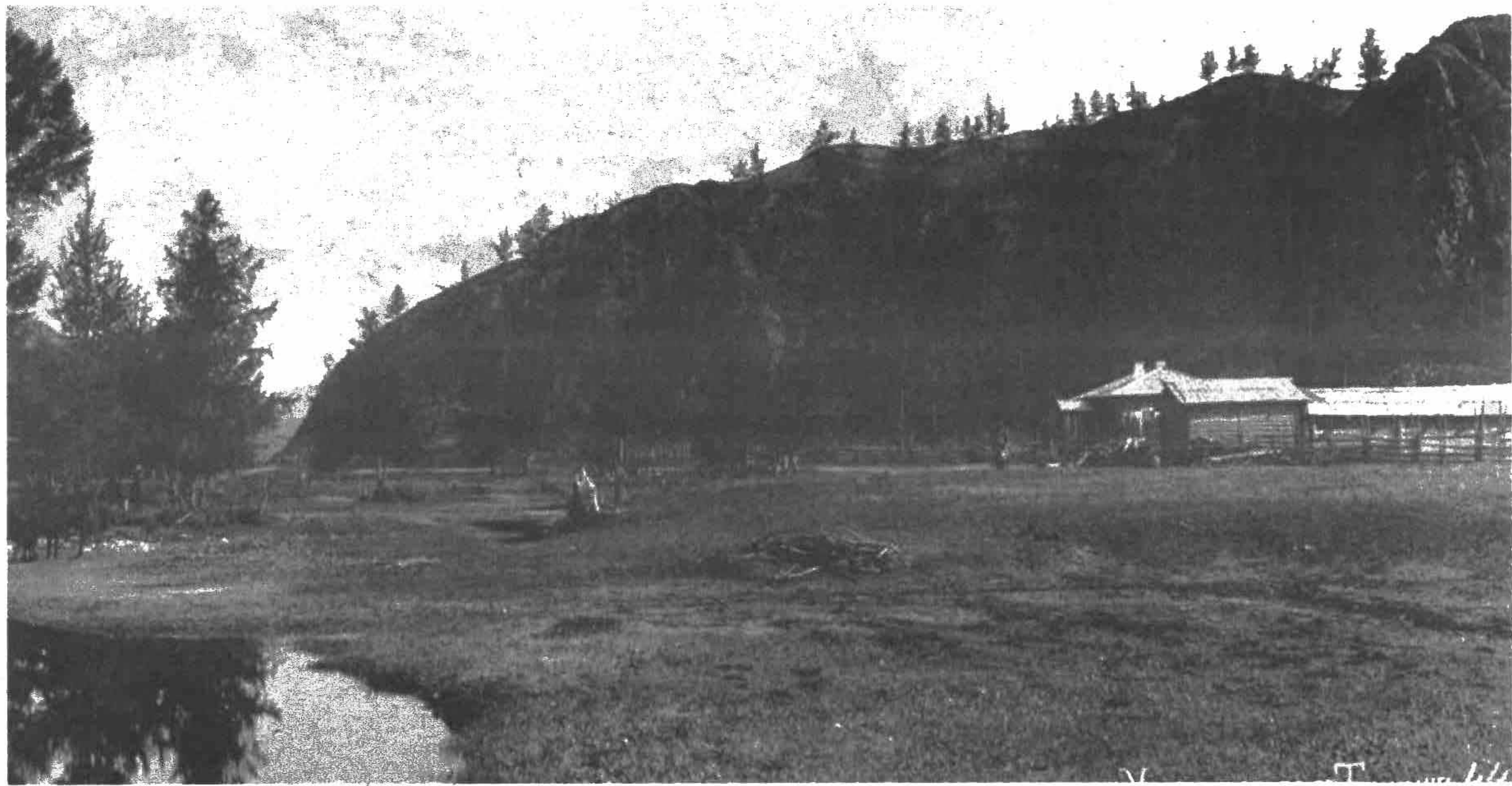
Удунгинский тракт. Станция Тёмник.

В большой нише, у задней стены храма, на троне находится главный идол Курху-Гилхе, «спаситель от всяких несчастий», в четыре человеческих роста, окрашенный в кроваво-красный цвет. У ног его скорчился побеждённый им злой дух. На длинных и узких столах находятся принесённые в жертву идолам предметы, в основном