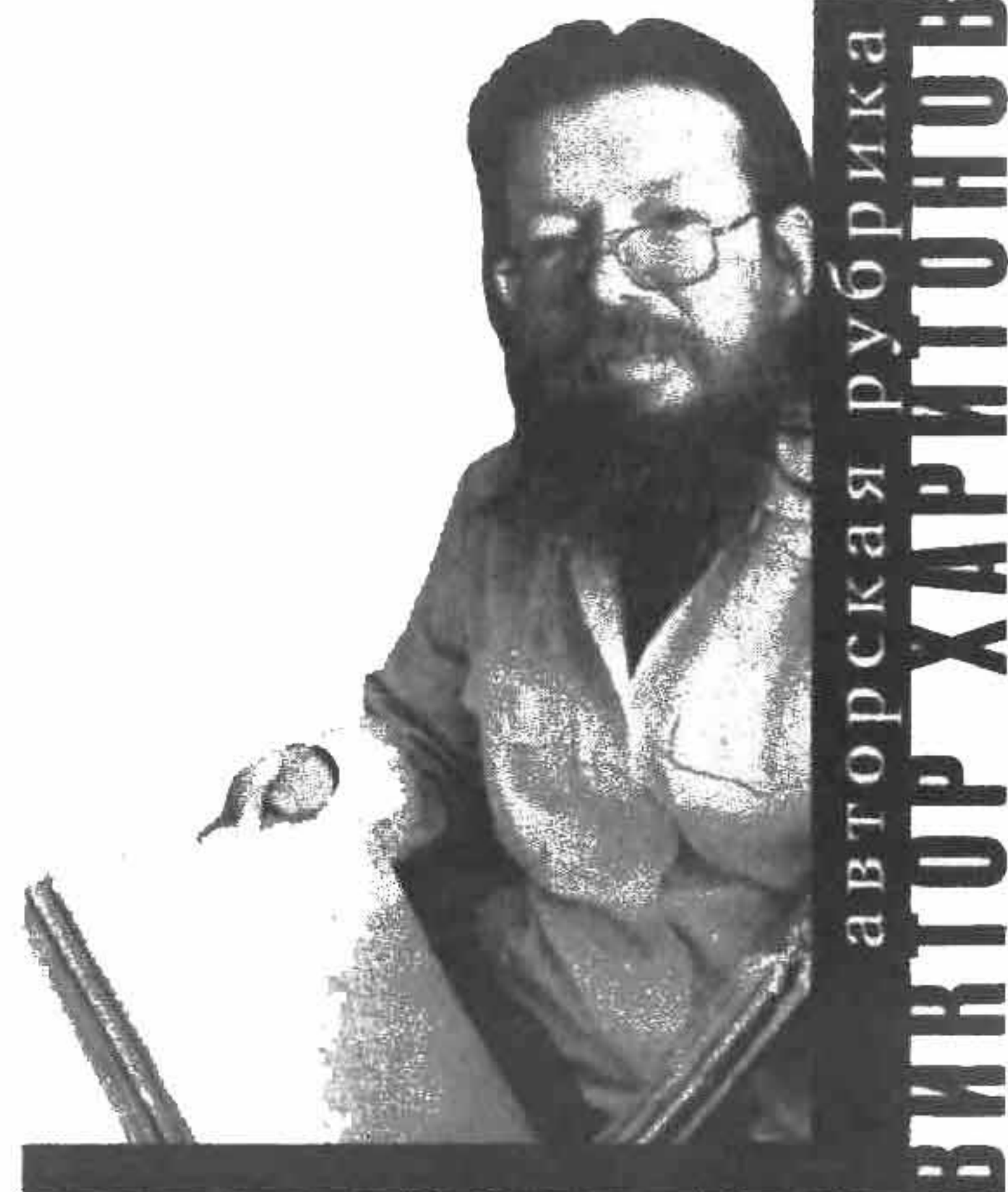
авторская рубрика ВИКТОР ХРИТУНОВ